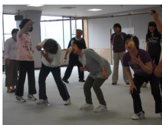
パンを上手にとれるかな？ 手を使わないのは難しいですね！