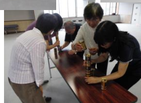
空き缶をたか〜く積み上げます！ みなさん上手に積み上げました。