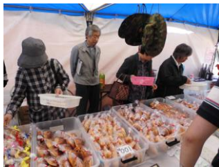
どれにしようかな〜♪