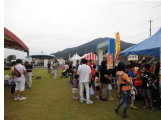
他にも色んなお店がありました。