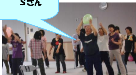
風船をうまく後ろへ送ります！