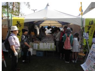
多くの人でにぎわっています！

毎年恒例の花里音のテントでは、パン・菓子の販売の他にコーヒーとビワミンさんのビワミンの販売をしました。朝からの販売のため、夜中からパンを焼き始め、たくさんの種類がありましたがおかげさまですべて完売しました。販売に参加した利用者もとてもうれしそうでした。