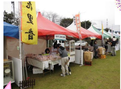
パンもお菓子もおいしいよ!