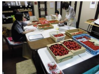
きめさややトマトの分量を量っています