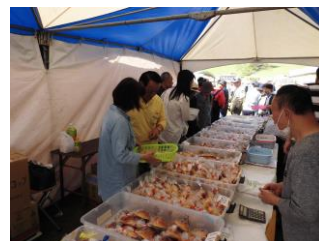
いらっしゃいっしゃい！ おいしいパンだよ〜♪