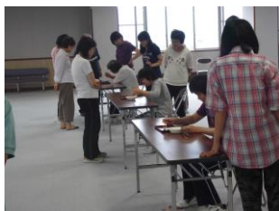
豆に集中！！ なかなかつかみにくかったです。

まずラジオ体操でからだをほぐし、ピン倒し、空き缶積み、輪投げなどの競技や、豆つかみで手先を使う競技、パンやジュースの早飲みなど、時間いっぱい楽しみました。