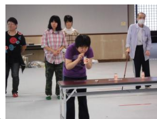
ジュースの早飲み♪ がんばれ〜！