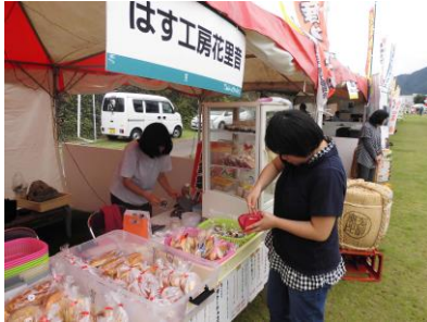
お買い上げありがとうございます♡

販売コーナーも体験コーナーも多くの人に来ていただきました。参加した利用者も声を出しながら、自分たちの作った商品を販売しました。