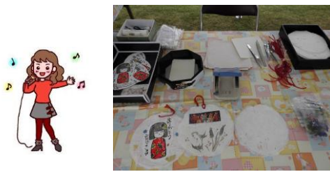
ハスの色紙に押し花を貼ります